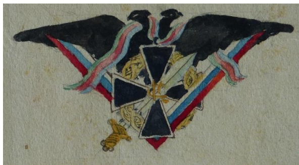
Рис. 2. Проектный рисунок нагрудного знака Кубанско-Софийского училища, выполненный юнкером Константином Кулешовым 25 июля 1919 года. 25 января 1920 года был утвержден с дополнениями Войсковым атаманом Н.А. Букретовым

Первый вариант представлял собой двуглавого орла черного цвета, перевитого лентой кубанских национальных цветов. На ленте подвешен крест черного цвета – «Крест Спасения Кубани» на фоне щитка георгиевских цветов. Под орлом помещен шеврон из русских национальных цветов, углы шеврона перевивают знак за Первый Кубанский поход и крылья орла. На крыле орла и перевивающем угле шеврона помещены монограммы Кубанско-Софийского училища, состоящие из букв «К» и «С».