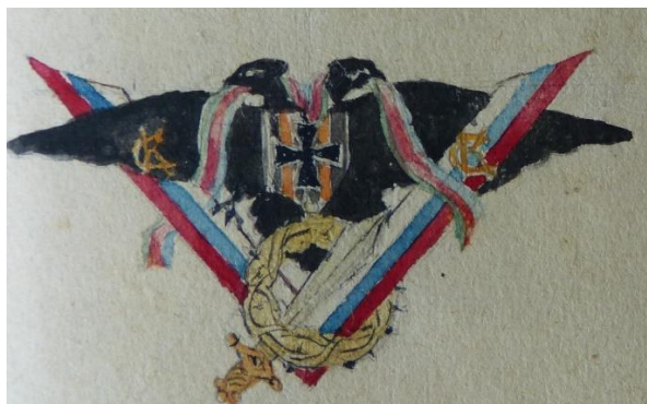
Рис. 1. Проектный рисунок нагрудного знака Кубанско-Софийского училища, выполненный юнкером Константином Кулешовым 25 июля 1919 г.

Согласно документам, 25 июля 1919 года юнкером 2-й сотни Кубанско-Софийского военного училища Константином Кулешовым были подготовлены два варианта проектных рисунков нагрудного знака (рис. 1, 2).