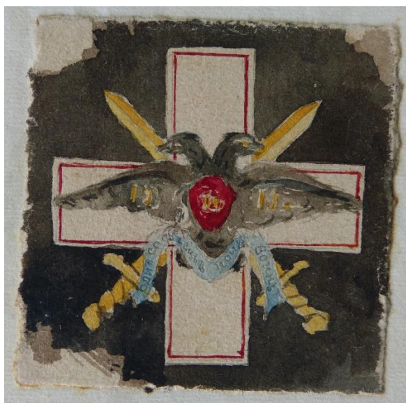
Рис. 3. Недатированный проектный рисунок нагрудного знака Кубанско-Софийского училища

Отметим, что кроме проектов работы юнкера Кулешова в деле подшит документ с еще одним вариантом знака Кубанско-Софийского военного училища (рис.3).